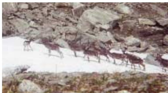
Mine første villmarksfoto fra Nordfjella, rein ved Godfjell