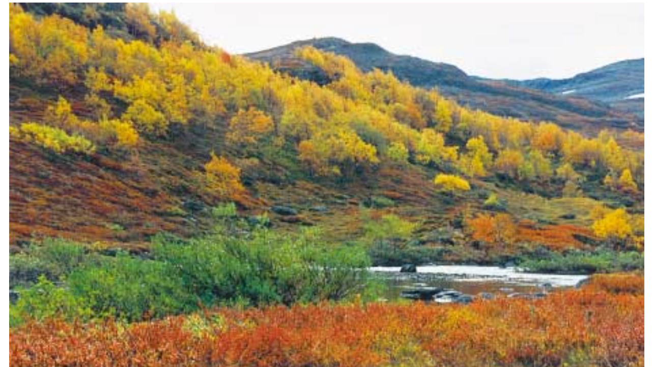
Høst ved Urvasbotn

Når jeg drar vekk så ikke glem der vest i fjella er mitt hjem