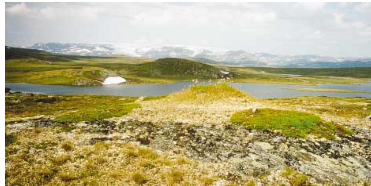
Ugletue mot Hardangerjøkulen